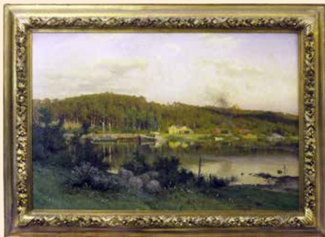
Målning av Olof Arborelius, signerad 1882, heter "Kräftburarna". Ser du alla "tecken" i tavlan? Den ägs av Engelsbergs Konstgille och kan på förfrågan beses i verkligheten.

Kom du med bil, tåg, båt, cykel? Sätten är många, som för 150 år sedan. Kanske tänkte Olof Arborelius så när han, mot den blanka Åmänningen, speglade transporterna till och från hans älskade sommarviste Ängelsberg. Segelskutan, kommer den med ved till alla kakelugnar? Ångbåten, ska den ta patron ner till förhandlingar i Västerås om tackjärnets vidare utskeppning? Och tåget, den stora nymodigheten, som fraktar snabbare än de gamla fororna. Järnvägen finns kvar, och det gula stationshuset, och båtar kan ännu siktas. Men den skogklädda sluttningen, som representerar dåtidens kapital kolet, kläs nu av det som blev nytt kapital när bruket las ner, dvs pensionat med tinnar och torn, som lockade luftgäster från landets alla hörn. Eller så tänkte inte Arborelius alls på transporterna, utan på de ljuvliga kräftfesterna som stundade.